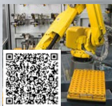
FRAISA ReTool®: 有性能保障的工业化刀具修磨