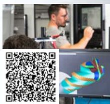
FRAISA ConcepTool: 量身订做的非标刀具