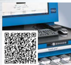
FRAISA ToolCare® 2.1: 刀具管理、采购与信息系统