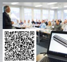
FRAISA ToolSchool: 培训与进修