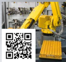
FRAISA ReTool®: Rigenerazione utensili industriale con garanzia di rendimento