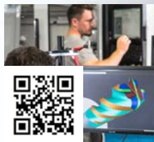
FRAISA ConcepTool: utensili speciali su misura