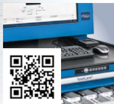
FRAISA ToolCare® 2.1: sistema di gestione, acquisto e informazione per utensili