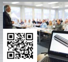
FRAISA ToolSchool: formazione e aggiornamento professionale